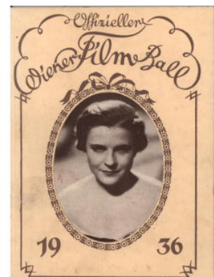
Paula Wessely 1936 auf dem Titelblatt des „Wiener Film Ball“.