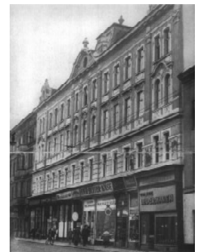
In der Sechshauerstraße Nr. 13 wurde Paula Wessely 1907 geboren.

Als Josefine in „Cyprienne“ beging Paula Wessely 1924 ihr Debüt am Wiener Deutschen Volkstheater. Ihr Filmdebüt und ihren internationalen Durchbruch feierte sie zehn Jahre später in Willi Forsts Film „Maskerade“. Ihr Engagement in der NS-Filmproduktion, insbesondere im Propagandastreifen „Heimkehr“, warf einen Schatten auf ihre Karriere.